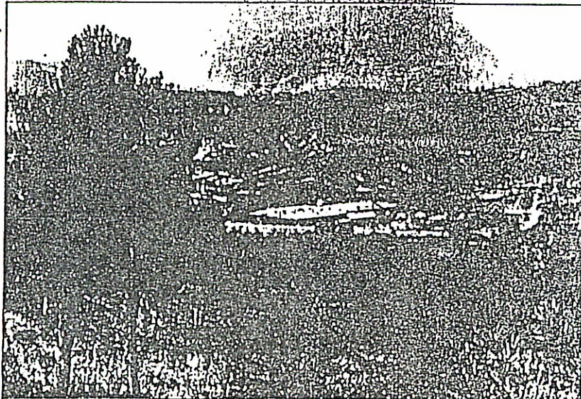
Imagen del pequeño valle donde se ubicó el complejo hotelero, en uno de los pulmones de la provincia.