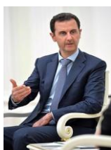
Bashar al-Assad hijo