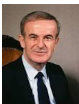
Háfez al-Asad, padre

VI .- Podemos hablar de la Guerra de Siria , Bashar al-Assad, donde los Occidentales estamos manteniendo a un presidente que es un dictador (lo nombró el otro dictador del país que fue su padre...), sanguinario y mal dirigente. Y lo mantenemos porque es doctor, es amable con los cristianos y, sobre todo, porque es pro occidental... ¡Nos cae bien!, ¡qué guapo es...!, ¡Podría pasar por un Occidental...!, ¡Es tan educado y delicado...! ¡Es médico y estudió un posgrado en Londres...! ¡Le deberían cambiar el nombre y llamarlo José...!