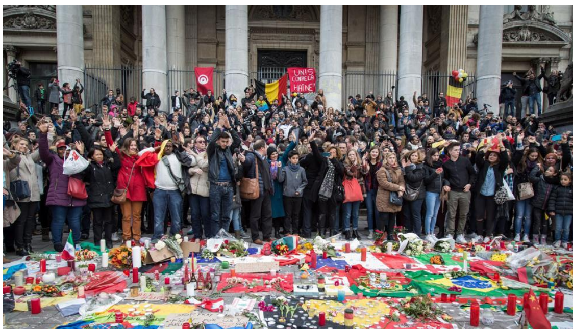
República/Efe | Bélgica | 19/03/2017

Hace unos días en una de las tertulias en televisión escuche los argumentos de un dirigente de Podemos que aportaba razones para explicar porque no quisieron firmar el Pacto Antiterrorista... Decía que ellos estaban en contra de los actos terroristas, pero no estaban a favor de las medidas que se desean tomar en función de los mismos, que no estaban de acuerdo con lo que se deriva del Pacto Antiterrorista... el dirigente de Podemos aportaba, como argumento en defensa de sus posiciones, las diferentes resoluciones de la Onu respecto del fenómeno terrorista yihadista y lo que en el mismo sentido dice el Papa Francisco...Sin embargo, estas voces disonantes no son escuchadas . Cuando surgen del Papa, nadie lo califica como simpatizante de Podemos, pero se amortigua el mensaje con la expresión de que es cosa de curas angelicales cuyos mensajes no son de este mundo..