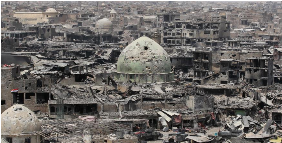
Una parte de la destrucción cometida en Irak