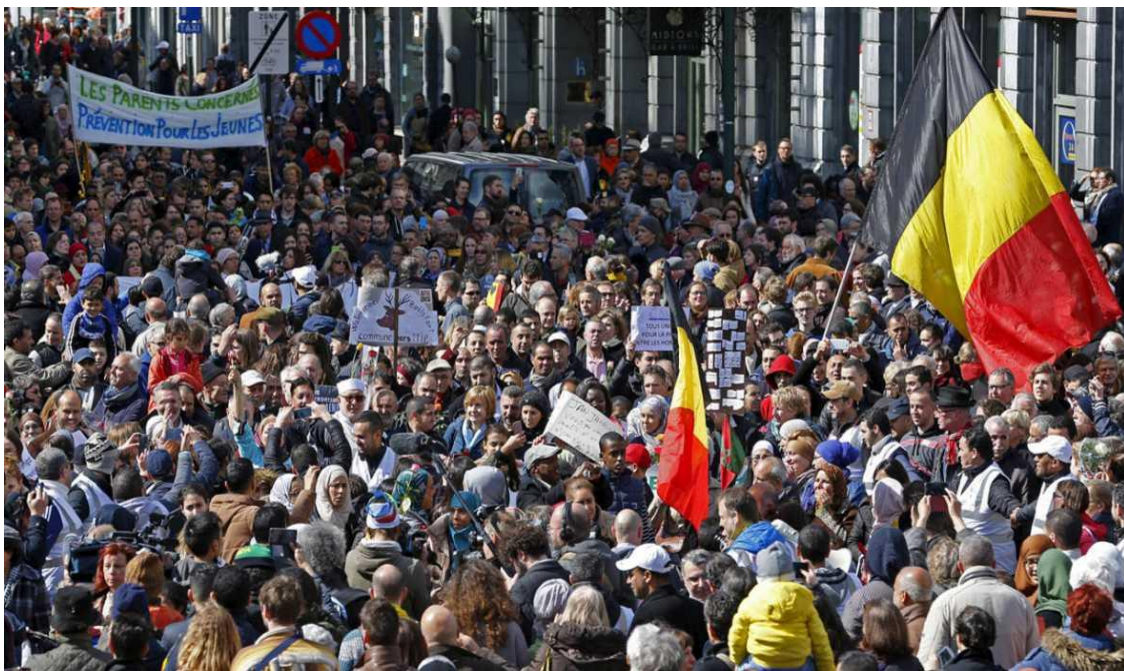
Miles de personas se manifiestan en Bruselas contra el terrorismo

III .- Aceptamos, pactamos y defendemos al dictador de Siria , Bashar al-Ásad, un personaje que el único merito que tiene es el de vestir como un Occidental. Este hijo de dictador y continua dirigiendo el mismo país que arruinó su padre... Nadie dice nada. Emerge una guerra, pero como no nos fiamos de la actitud de los contendientes del bando contrario, apoyamos a un dictador para mantener el statu quo y de paso, favorecer que el país se destruya en un conflicto sostenido con miles de muertos, millones de desplazados y una emigración que arrasa Europa... ¿Hacia dónde nos dirigen estas actitudes?