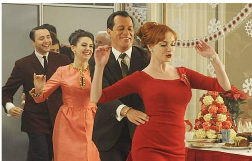
¿Quién paga la fiesta? ¿No lo sabemos, pero seguro que nosotros no...!. ¡A seguir, que esto mola..!

La actuación es lógica, la medida coherente y la respuesta lo es mucho más. Os aseguro que en su lugar yo haría lo mismo... “Dicen que los negocios se hacen bien, cuando ambas partes salen satisfechas. Cuando ambos creen que han ganado con el acuerdo...” Por esta razón, es maravilloso que me inviten a una “fiesta” que pagaré yo pero que nunca me enteraré de que la he pagado... ¡Es fantástico, un negocio redondo...!, porque todos disfrutamos de la “fiesta” sin el mal sabor del pago de su coste. Esa es la esencia de la ignorancia fiscal: “crear un Jardín del Edén, en el que todo el mundo es feliz, porque todos disfrutan y nadie percibe que paga...”