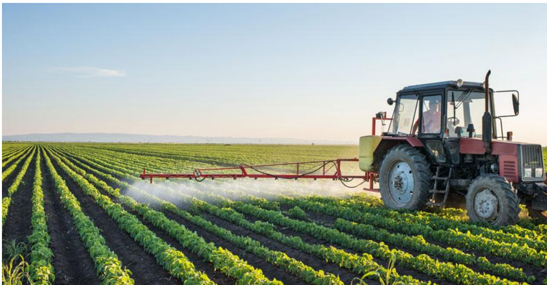
De Randstad, crónica agrícola 27 Jun 2016

Es el problema de la agricultura y de la política en general, dar remedios sin asumir el diagnóstico. No se pueden hacer prescripciones sin diagnóstico. ¡Que error estoy cometiendo!. ¡Es muy grave el error que estoy cometiendo ahora!. Es grave porque sí que existe diagnóstico, pero está equivocado. Muy equivocado. El diagnóstico del Sector Institucional dice que el problema lo genera siempre un tercero. El problema de la falta de rentabilidad de la algarroba es achacable: * a Europa; * a la falta de formación y de información del pobre labrador; * a los mercados especuladores del mundo que nos rodean; * al comercio que intermedia y juega con los márgenes a su favor, * a la falta de sensibilidad del consumidor por lo verde...; , o * a Mercadona... Mejor a Mercadona porque es el principal culpable que chuparle la sangre el agricultor al que explota con sus precios... Si creo que Mercadona es un enemigo adecuado, porque genera un ejército de represaliados que permiten agrupar caldos de cultivos en contra de una empresa eficiente.