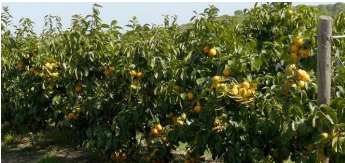
Producciones de caqui en la provincia de Huelva.

Se están desarrollando a la chita callando , sin hacer ruido. De manera lenta, pero inexorable, van adquiriendo el tamaño que el mundo les demanda. Con problemas, pero con futuro. Sin subvenciones (o con subvenciones conseguidas por un gestor externo que se queda una comisión si las consigue y si no las consigue no pasa nada) y sin culpar a nadie de sus males, solo a ellos, solo a su gestión. Solo a sus fuerzas.