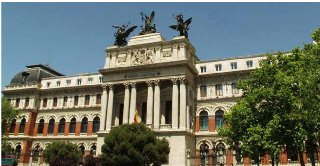
Palacio de Fomento, sede del Ministerio de Agricultura