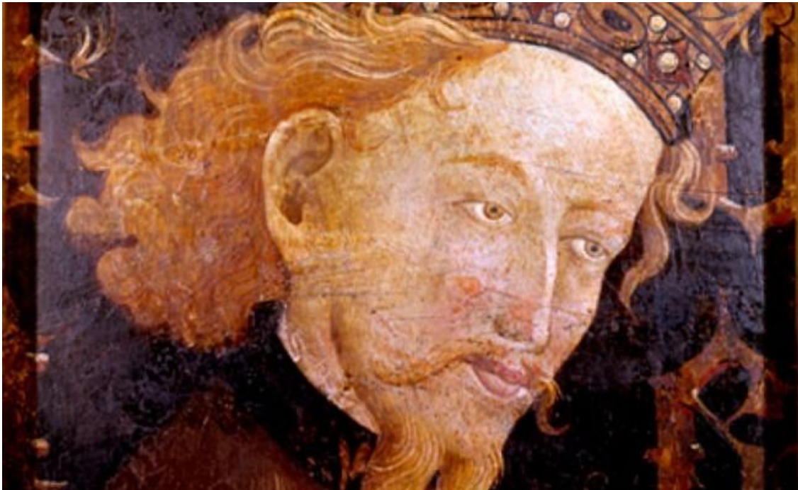
El Rey Jaime I

4.- Europa es la novedad. Su actuación es torpe, senil e inadecuada, porque si tuviera visión y sobre todo, liderazgo, se hubiera dado cuenta de la existencia de que los Nacionales han creado de manera silenciosa una fábrica que produce independentismo. Cada día más. Sin embargo y, a pesar de esta inadecuada posición, Europa es clave porque no va a consentir detenciones prolongadas (acabo de saber que han llevado el conflicto del Proces ante la ONU), ni tampoco muertes en sus calles. No porque Europa tenga sensibilidad, ni entente, si no por pura imagen pública: la Europa democrática no puede aceptar detenciones masivas de políticos, ni ciudadanos muertos por sus ideas. Digamos que Europa es un freno para unos nacionales que son capaces de todo para mantener una unión imposible.