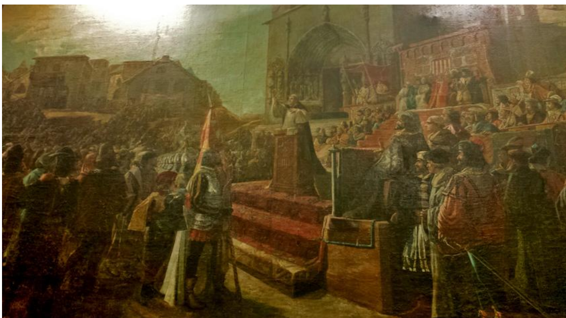
El Compromiso de Caspe