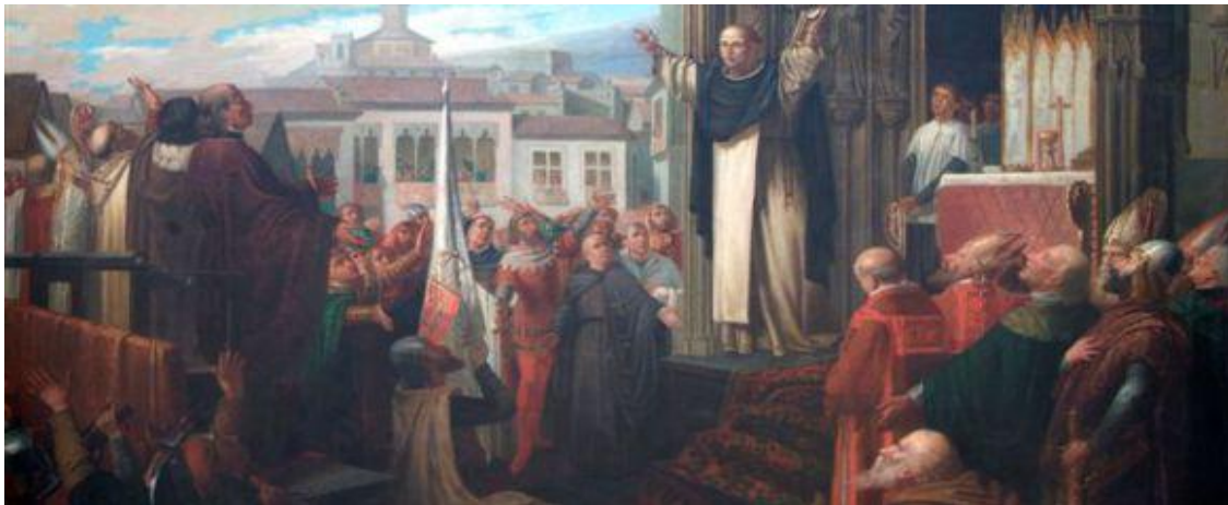
San Vicente y el Compromiso de Caspe

5.- Felipe Gonzalez fue el precursor de un nuevo concepto del nacionalismo español. Es que el más ha favorecido la Unidad Patria Moderna, porque es el que más cerca estuvo de alcanzarla. Actuó con la sutileza de quien conoce el problema y sabe que solo se puede unificar con el reconocimiento de las diferencias y desde el respeto y la tolerancia. Es la política que desarrolló a lo largo de su mandato, cuyos resultados fueron positivos para crear un espacio común y, al tiempo, fortalecer el tipo de unidad que demanda un Estado moderno.