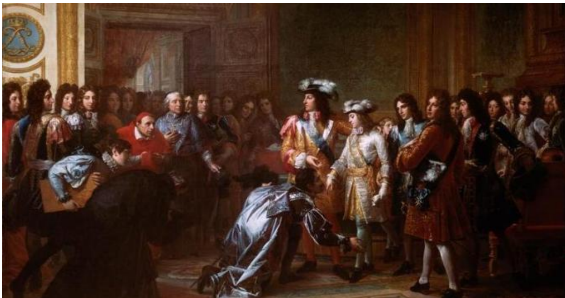
Proclamación de Felipe V como monarca español

3.-El Procés comenzó con la ruptura de los Pactos de la Moncloa por parte del gobierno de Aznar y con actos como la puesta en escena del Poder Nacional cuando el entonces ministro Trillo, puso una macro bandera roja y gualda en la Plaza de Colón, con la pretensión de asustar a los regionales . A continuación vino el asunto del Estatut y lo acabó de rematar la intervención del Tribunal Constitucional cuando acepto la petición del PP de anular buena parte del Estatut después (1) de ser aprobarlo por el Parlament de Catalunya; (2) de ser votado por los ciudadanos catalanes a través de un Referendum (3) de ser sancionarlo por el entonces Gobierno de Zapatero ; (4) de ser sancionado por la mayoría de los españoles a través de sus representantes en el Parlamento Español (aunque en el proceso fue modificarlo sustancialmente para que fuera aceptado por la Villa y Corte de Madrid). A pesar de todas estas adhesiones, el Tribunal Constitucional favoreció el resurgir del nacionalismo independentista anulando aún más su ya mutilado contenido, todo ello, en el marco de la petición que le formuló el representante del nacionalismo español, el Partido Popular.