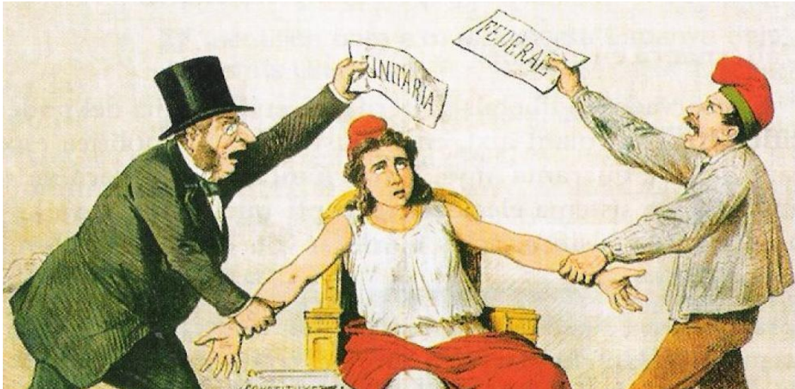
La Primera Republica Española

y por ende de atracción de las ideas, los unionistas han hecho una mala campaña de atracción de adhesiones, porque han hecho lo contrario de lo que deberían haber hecho: tocar el callo para que todos se levanten . Es lo que me decían a mí de pequeño y es lo que siempre he visto desde Valencia. Sin embargo, los dirigentes del unionismo o son torpes o tenían otros intereses ocultos, en virtud de los cuales no les importaban los resultados de Catalunya, si no los del resto del Estado.