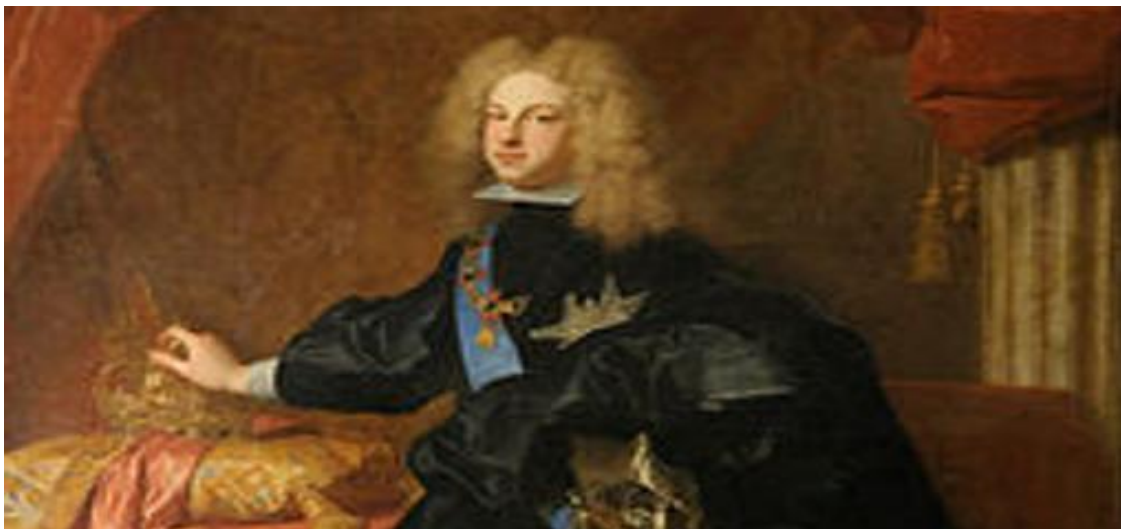
Felipe V de joven

en este asunto no hay escrituras de propiedad, sobre todo, cuando no es un problema inventado, si no que se puede documentalizar que está vivo desde el siglo XIII, que se incrementa en el siglo XVI y se acentúa de forma dolosa desde el siglo XVIII hasta nuestros días, sin haber podido elegir democráticamente cual es su espacio de pertenencia.