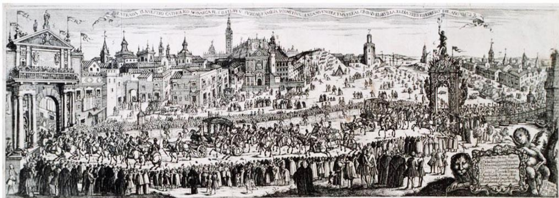
Felipe V entrando en Sevilla

2.- LA CORRUPCION Y LA IMPUNIDAD ESTAN FORMANDO PARTE DEL LENGUAJE CUOTIDIANO y eso es bueno, porque el Estado no es creíble con una cuota inaceptable de corrupción y, sobre todo, de impunidad, porque corroe todos los cimientos que sustentan una convivencia razonable.