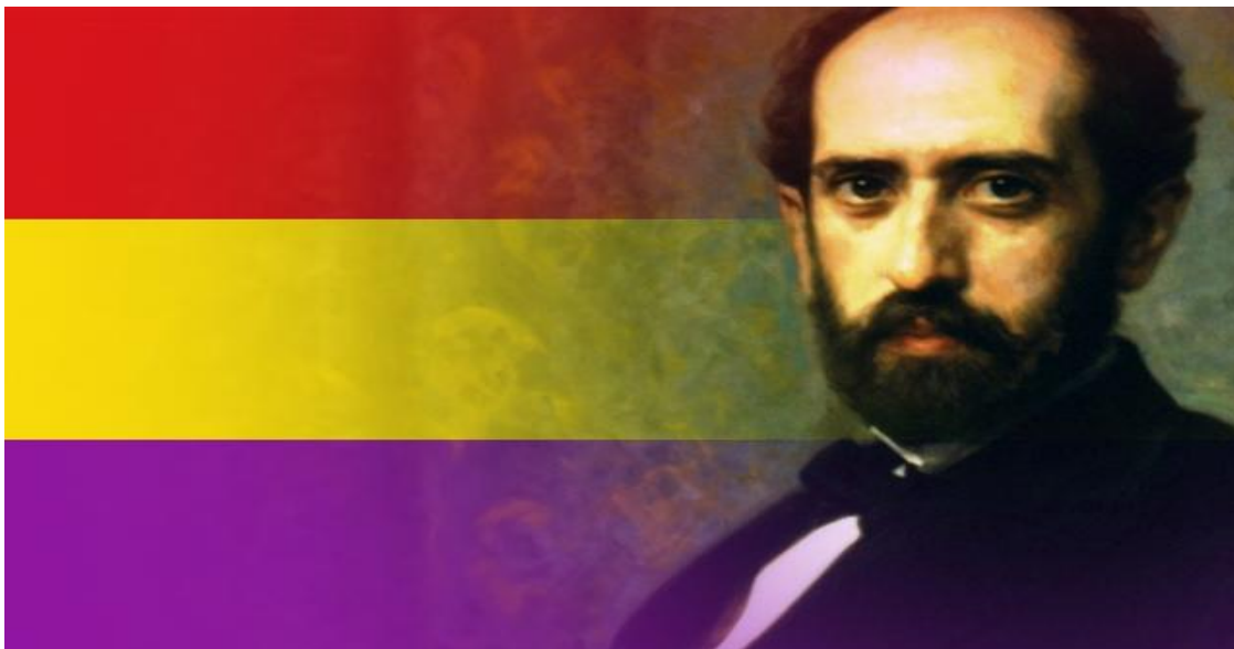
Salmerón y la Primera Republica