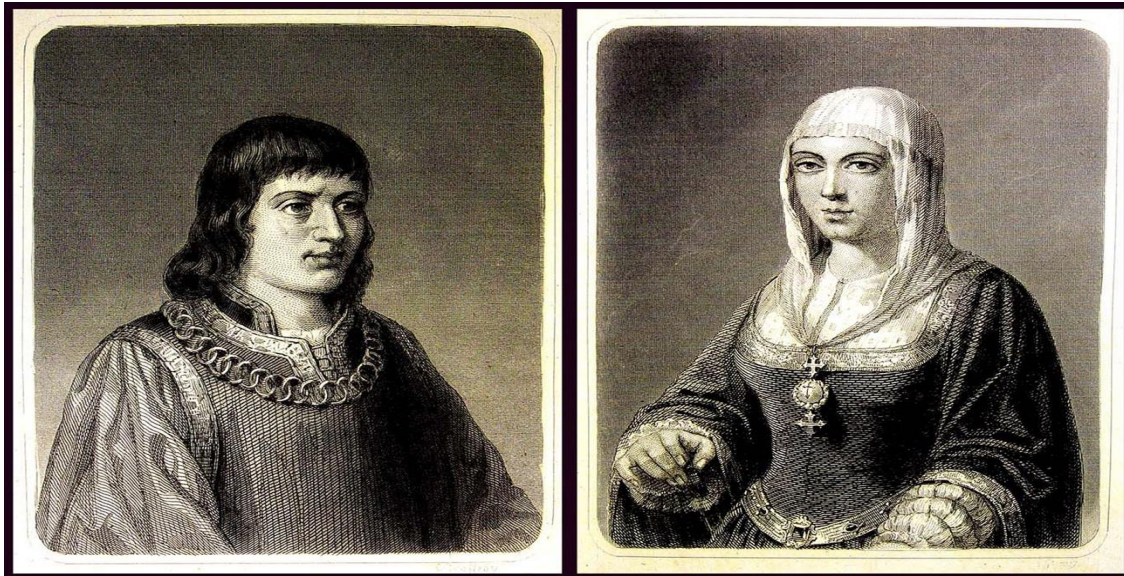
Fernando de Aragón e Isabel de Castilla