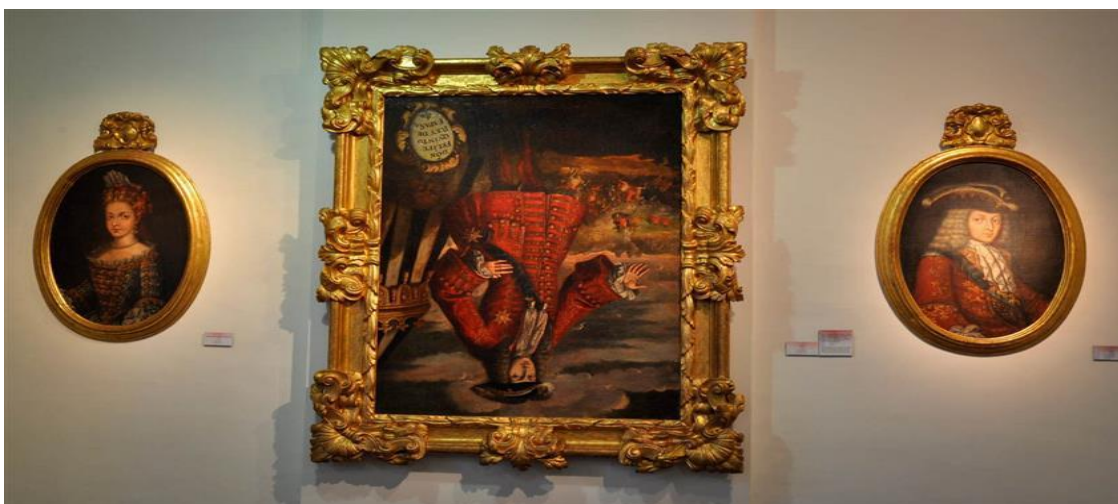
Cuadro de Felipe V en el museo de Xátiva

Si hubiera una autoridad que se ocupara de la gestión de los jueces y, por ende, de la imagen de la Justicia ante los ciudadanos, debería tomar medidas y evitar que sean los Jueces los responsables de resolver los problemas que solo los políticos deben gestionar, porque el 47% de una población de 7,5 millones de ciudadanos nunca se equivoca, aunque cometa errores garrafales, porque ellos son los que tienen la legitimidad, no los jueces. Sobre todo, cuando se trata de delitos sin sangre y sin apropiaciones de dinero.