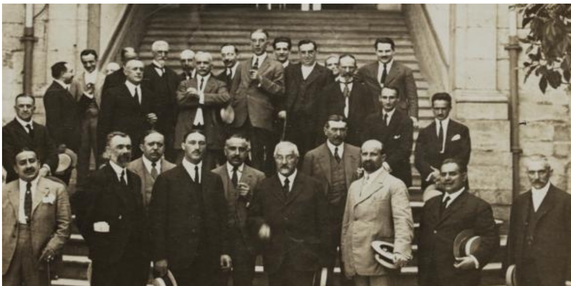
La Mancomunidad Catalana

Cup; (5) Izquierda Unida; (6) el PNV; (7) los partidos nacionalistas vascos; (8) los partidos nacionalistas gallegos; (9) militantes no oficialistas del Psoe o los oficialistas entre bastidores.