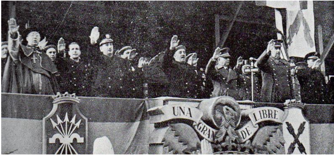
Lo más granado del Alzamiento Nacional

4.- LA MONARQUIA ESPAÑOLA ESTA HACIENDO PUBLICIDAD DE SUS ACTOS, lo que denota debilidad por el desafuero que ha provocado la Institución, tanto en los últimos años del reinado de D. Juan Carlos como en la inadecuada posición del monarca actual en el asunto catalán.