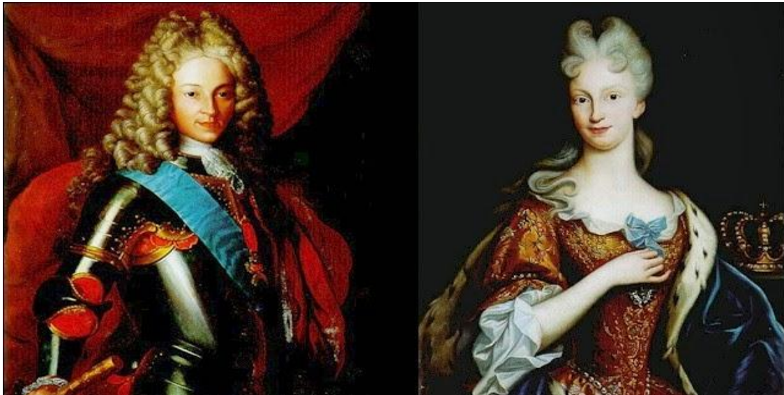
Felipe V e Isabel de Farnesio

La gestión que está llevando a cabo el Gobierno con el Proces , está castigando de forma mortal a la monarquía española, porque está haciendo emerger la legitimidad histórica de la República Española... No, cambio, porque la República Española tiene legitimidad pero no historia, porque nos acompañó durante pocos años.