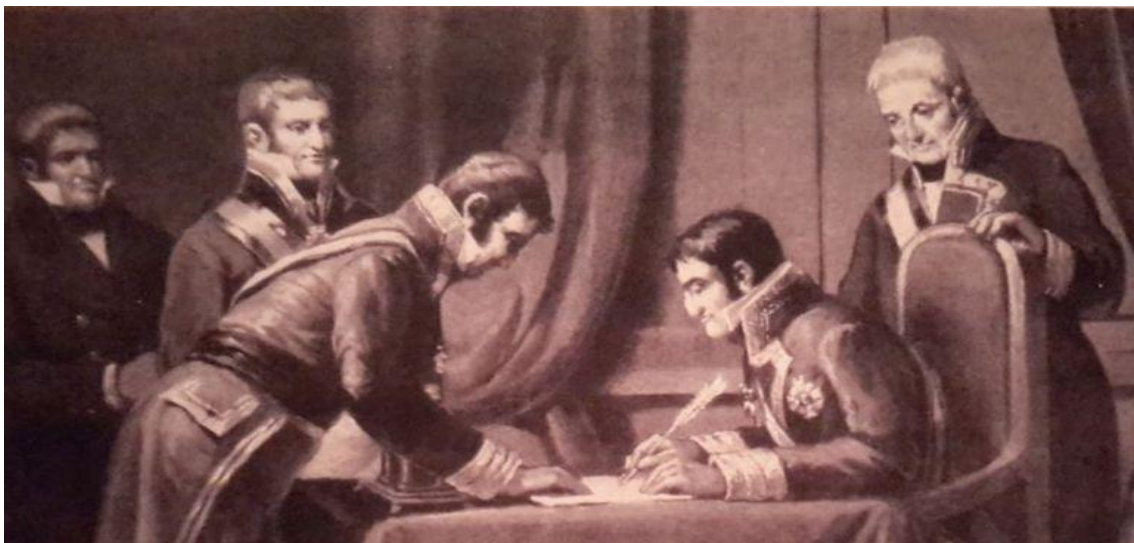
Fernando VII, firmando la derogación de la Constitución de 1.812

Para resolver el problema de la corrupción debemos tener una voluntad que en España no se constata, porque se piensa más en la instrumentalización de la corrupción que en resolverla. O dicho en otras palabras, la corrupción se utiliza más como una eficaz arma electoral que como una anomalía a combatir. Para resolver la corrupción, debemos actuar más y hablar menos. Todos. Porque la eficacia está en la norma y no solo en el Juzgado. Y la norma, debe ubicarse en la línea de flotación, no en la burocracia. Para acabar este largo escrito, pondré algunos ejemplos sencillos que nos pueden ayudar a resolver la corrupción: