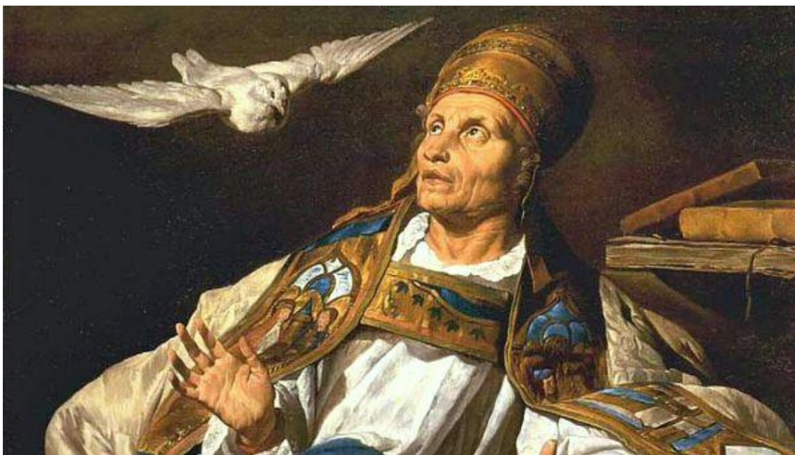
San Gregorio Magno