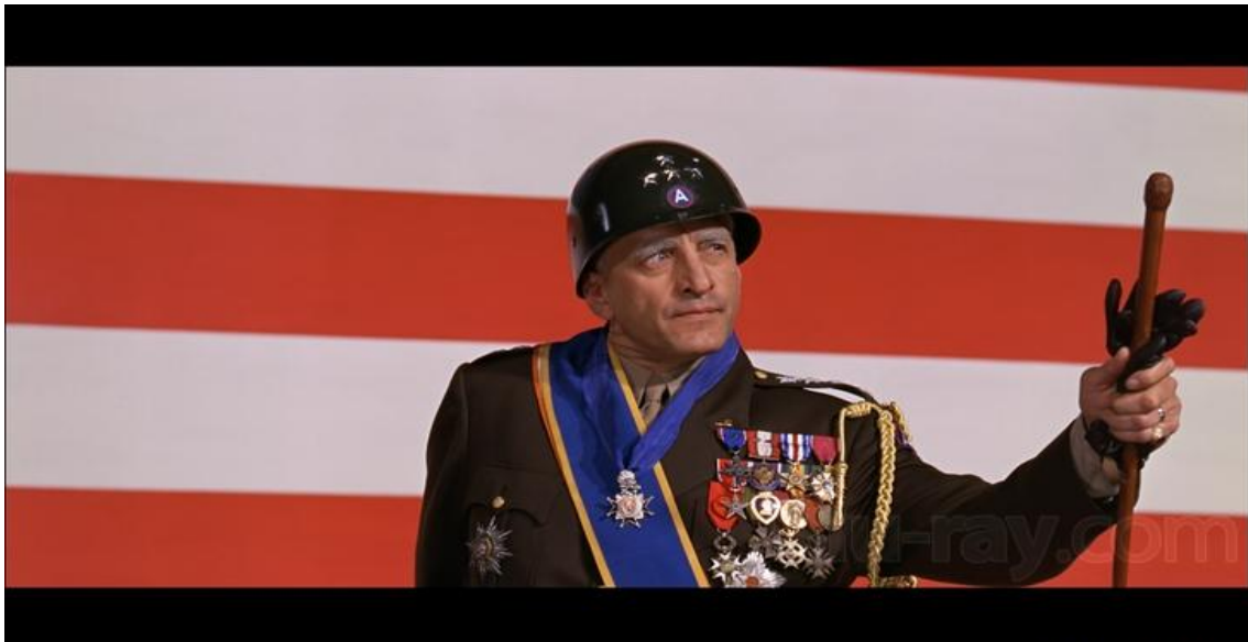
El general Patton

Hace unos días se publicó la noticia de que han descubierto que un funcionario lleva 10 años cobrando de un Organismo Público sin trabajar... ¿Qué haría usted si ocurriera un asunto similar a este en su grupo empresarial?. La primera medida sería despedir al grupo de directivos relacionados con el asunto (Director General, Jefe de Personal y Jefe de Sección) y luego despediría al empleado en cuestión, porque es mucho más grave el descontrol que el impacto financiero...Mucho más.