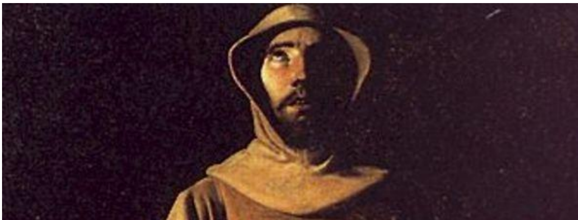
San Francisco de Asís