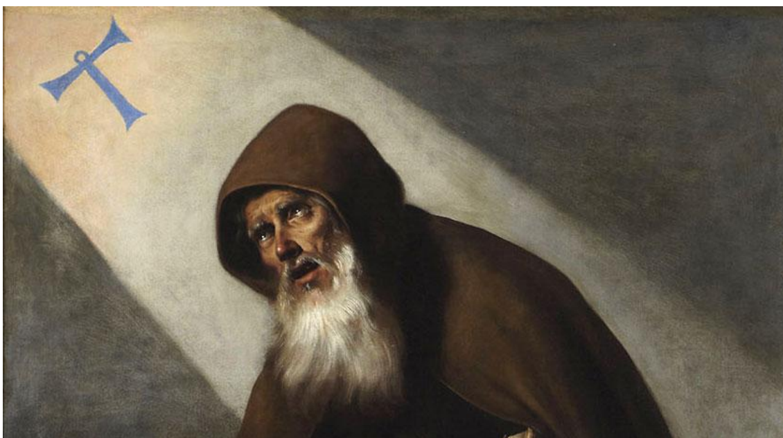
San Antonio Abad

El Regulador del Sistema parte de la base de que el político no es un ser humano normal, sino que debe ser un ser extraordinario; un ser humano perfecto que no necesita la orientación (y el control) de un regulador externo que guíe sus pasos. Y, por ende, el Regulador ha diseñado un Sistema adecuado por los humanoides , pero muy malo para los seres humanos que habitamos este planeta, políticos y ciudadanos.