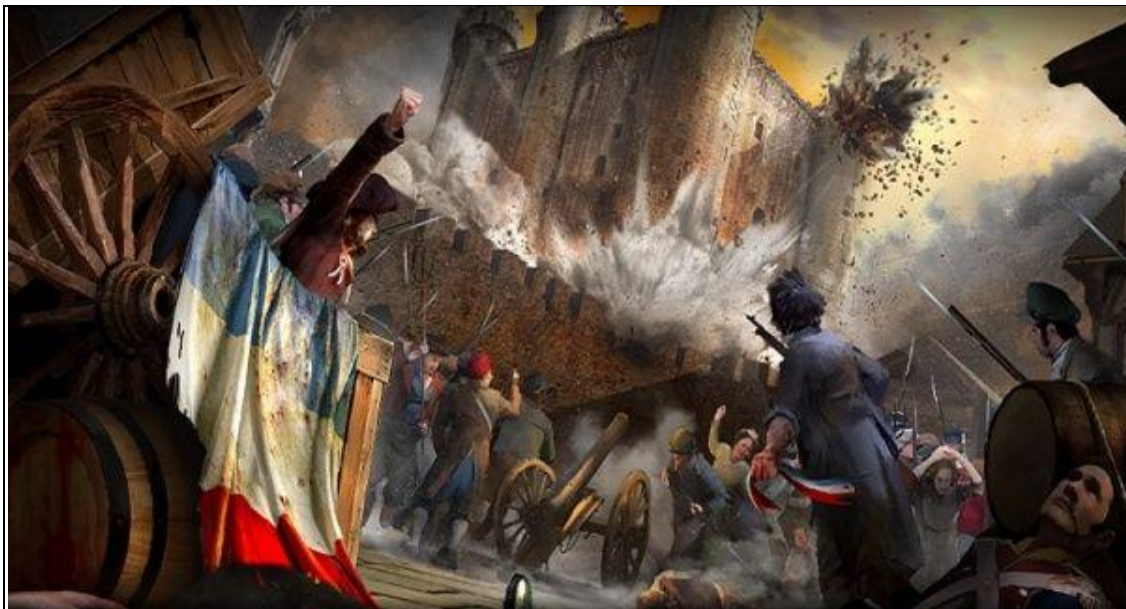
La Revolución Francesa

V. - La muerte anunciada de la prensa escrita tradicional, catalana y española . Esto es el fin de un negocio milenario que con el Procés constata el Final de sus días... Lo que financieramente no es viable, se debe cerrar, que es lo que acabarán haciendo los grandes medios de comunicación tradicionales.