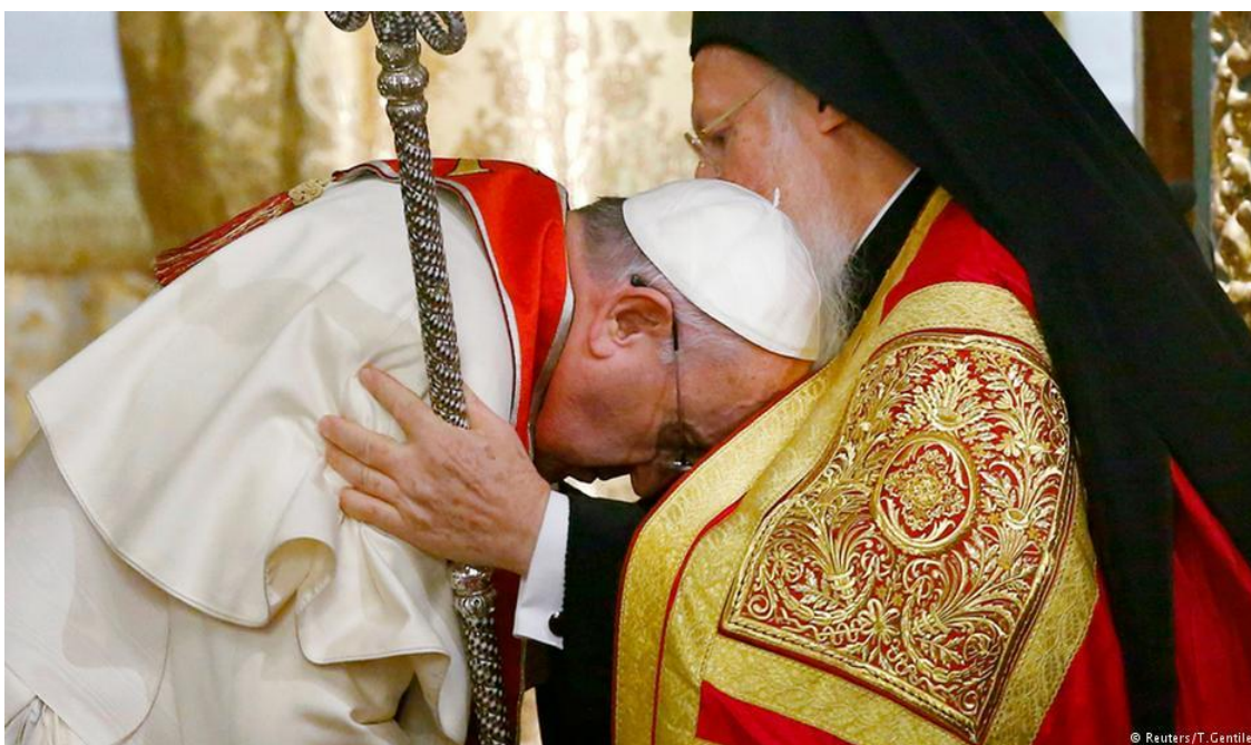
El gran papa Francisco, nos enseña el camino del perdón y la reconciliación

Un amigo hace un año me hablaba de la necesidad de depurar el Estado con el Fuego Purificador del que hablaba Tierno Galván... Que venía a decir que la Democracia Española necesitaba romper siglos de corruptelas Institucionales, que son las más complejas de resolver. Y esa misma persona, ahora está en las Antípodas, piensa en el Procés como los enemigos del Estado, escucha voces policiales y le parece bien cuando la Ministra hace alusiones al Ejército.