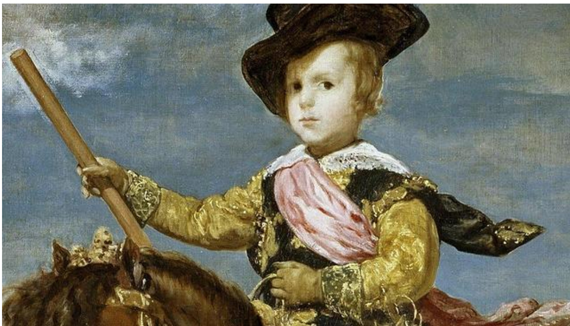
El príncipe Baltasar Carlos pintado por Velazquez

El tren del progreso ya está en los raíles, forma parte del discurso de la generación silenciosa , la de los Milleniums y de las posteriores, estos nuevos ciudadanos no permitirán ciertas actuaciones que nuestra generación ha consentido, por nuestro talante temeroso del poder y, sobre todo, por nuestra ignorancia fiscal, que todos los de nuestra generación la tenemos metida en el alma.