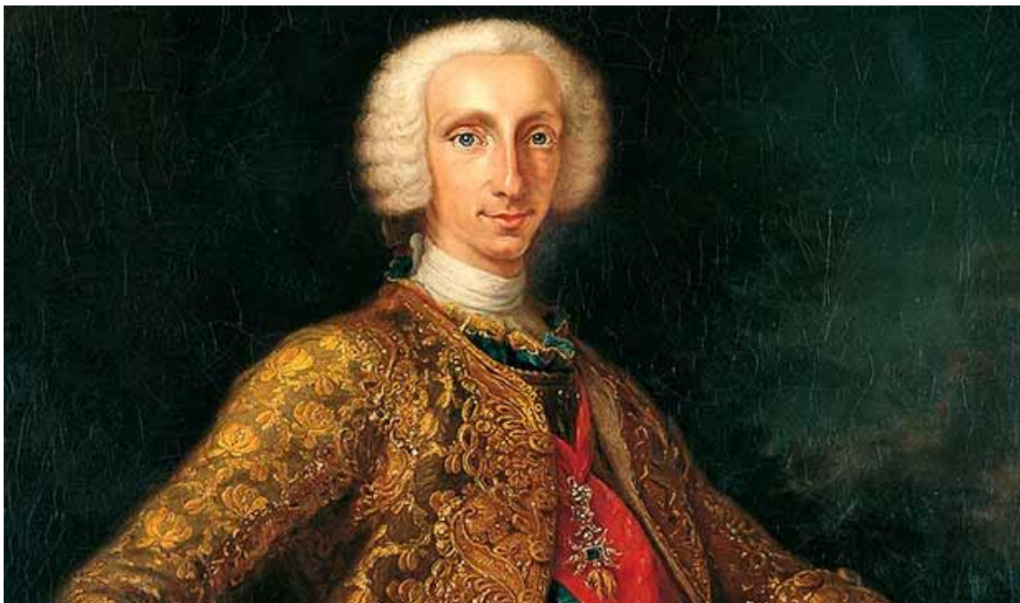
Carlos III, Rey de España, de joven

Ayer unos abogados me hablaban de la actuación de un fiscal. En una instrucción penal, el Juez le remite al fiscal un escrito de una de las partes con el objeto de que este se manifieste. La respuesta del Ministerio Fiscal tarda tres meses en llegar y cuando lo hace, dice que no se opone a las pretensiones de las partes, pero se equivoca referenciando en el escrito a una de las partes que nada tienen que ver con el procedimiento. Yo con mi ignorancia, le inquiero al abogado y le digo ¿Qué pasa en estos casos? . Me contestan al unísono, nada, solo que el error comportará cuatro meses más de retraso... ¡Nada más! . Eso es lo normal... ¡Eso es lo que hacen los funcionarios con nuestra anuencia! .