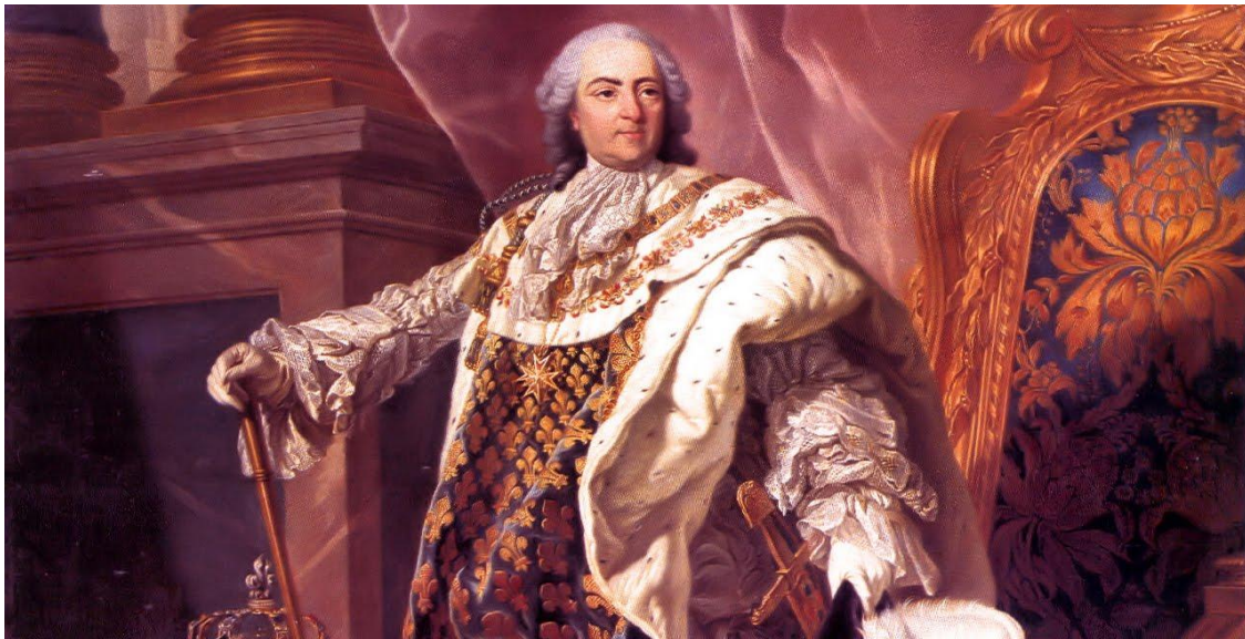
Luis XV de Francia