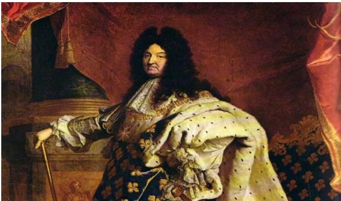
Luis XIV El Rey Sol

tiempo, no corre riesgos porque sabe que cuenta con una población anestesiada por un Sistema que ha provocado una ignorancia fiscal absoluta entre sus contribuyentes.