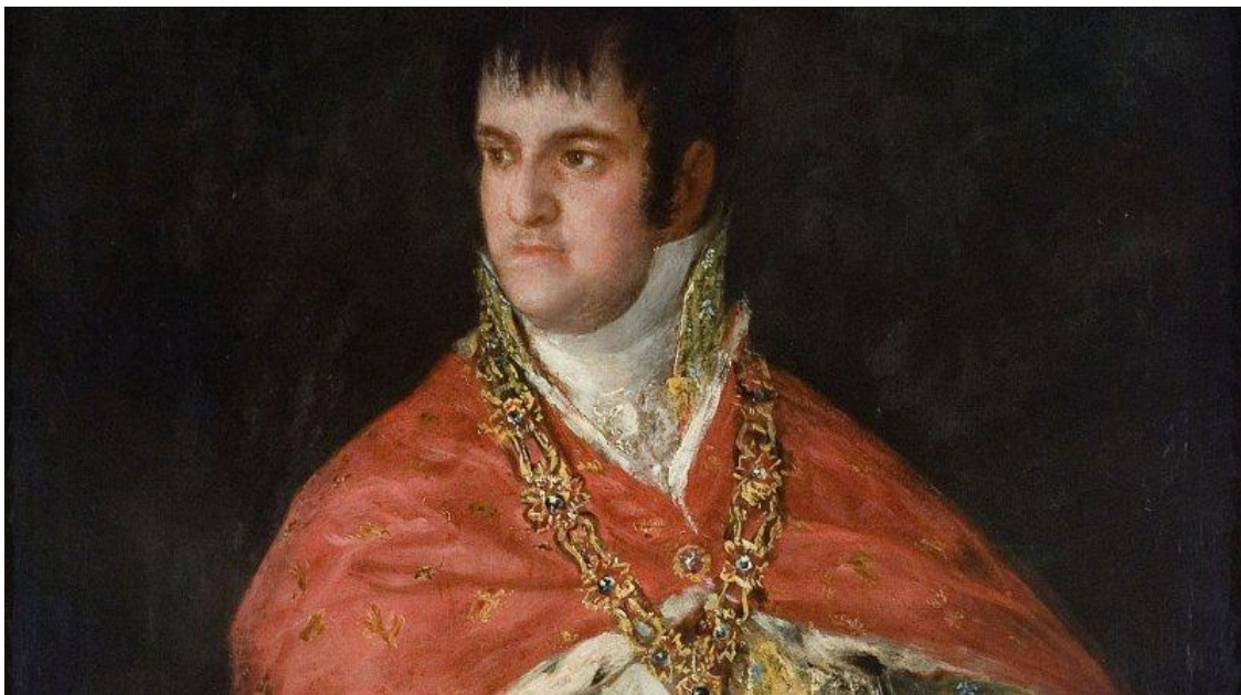
Fernando VII, Rey de España