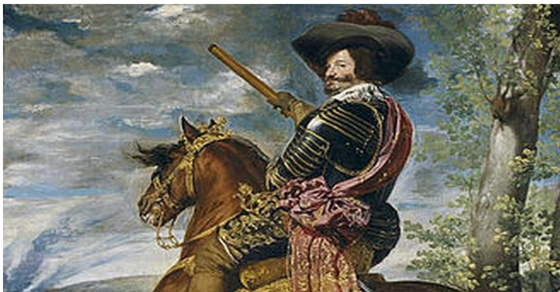
El Conde Duque de Olivares