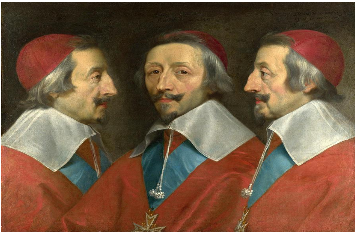
El cardenal Richelieu

¿Qué haría usted si no tuviera el control adecuado?. La respuesta teórica la daría un escolar: actuar de manera honrada... Sin embargo, nos debemos preguntar ¿Por qué hay ladrones? ¿Por qué tenemos un Código Penal? ¿Por qué se ponen multas de tráfico? ¿Por qué existe un Recaudador de Impuestos?. La respuesta es obvia y unánime: porque cada uno hace lo que le dejan hacer... Cada uno roba lo que le dejan robar... ¿Qué haría el cajero del Banco de Santander si no tuvieran auditorias, controles, arqueos de caja...? . .