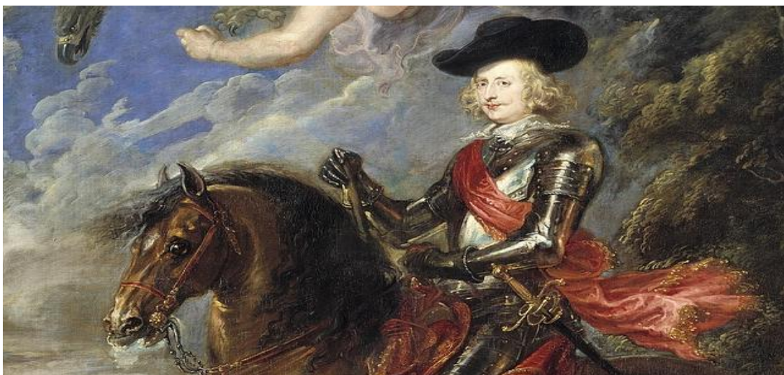
El cardenal-infante Fernando de Austria

Conviene dejar las cosas claras. Cuando tiramos un vaso de agua, el líquido no sube, sino baja... Las personas hacemos lo mismo, tendemos a operar con la Ley del Mínimo Esfuerzo , lo que supone que ningún ser humano normal se impone a si mismo controles ni cargas, para que un asunto funcione, se los tienen que poner terceros . Solo las Cortes Franquistas tomaron una decisión que suponía su muerte inmediata, el resto de los humanos no solemos tomar decisiones que vayan en contra de nuestros intereses inmediatos.