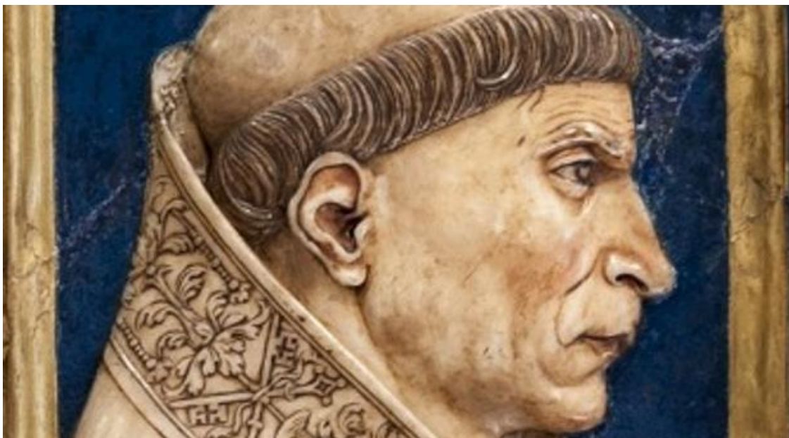
El cardenal Cisneros

¿Cuál es el problema?. Que existe una gran incongruencia entre el Sistema y sus pobladores. O lo que es lo mismo, que el Sistema está diseñado para que lo ocupen unos seres bondadosos que no necesitan control, porque se auto regulan... Sin embargo, el mundo está repleto de personas normales que no solo tienen tentaciones, si no muchas ambiciones, que pueden ejecutar con facilidad porque el Sistema no está preparado para interactuar con ellos, porque no tiene elementos de regulación adecuados.