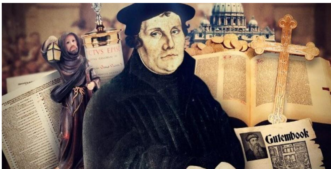
Martin Lutero, monje agustino