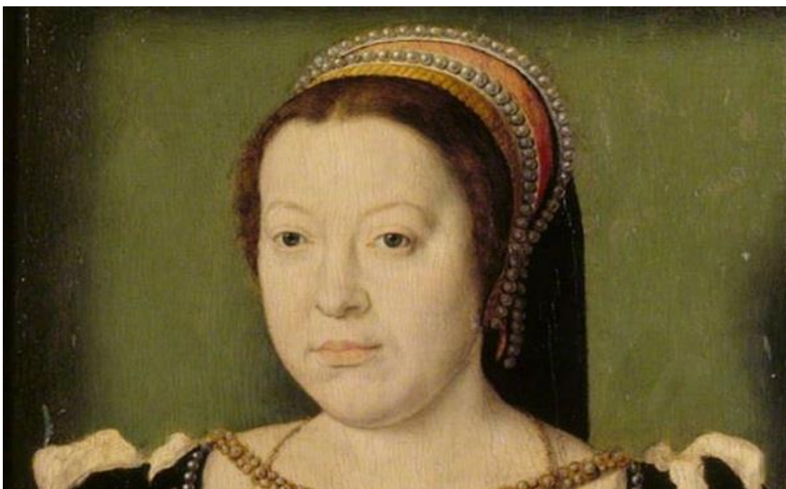
Catalina de Medici, Reina de Francia

D.- Las facultades para gestionar un negocio familiar se alcanzan solo cuando el sucesor ha demostrado sus capacidades con los resultados. Las palabras, la retórica y los planes no sirven, son sólo ruidos de fondo, el aporte de valor son los resultados constatables atribuibles de manera indubitativa al sucesor. Las escrituras de poder, los nombramientos, la parafernalia, los rituales, palabras, los planes y la retórica de poco sirven, porque las prerrogativas se obtienen por los resultados, por el aporte de valor al negocio, que motiva las adhesiones al sucesor y el abandono del amparo del fundador. Los sucesores deben tener claro que el poder se infiere del éxito.