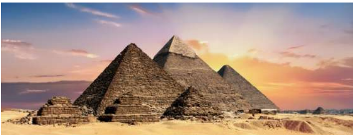
Las pirámides de Egipto

No es saludable identificar la Obra con la familia , porque las familias tienen una contribución pasajera, mientras que la Obra debe tener una consideración permanente. Las órdenes religiosas nos pueden dar lecciones sobre el asunto que estamos dilucidando, porque desde que nacieron distinguen muy bien entre el gestor y la Obra , entre la misión y los medios para conseguirla, entre los aportadores de recursos y la Obra , que es el resultado de un proyecto, la síntesis del aporte de valor para la sociedad. Por esta razón, la Obra suele perdurar más en manos de estas instituciones religiosas, porque saben que los gestores vienen y se van, pero las Obras permanecen, porque las crean para que sean eternas.