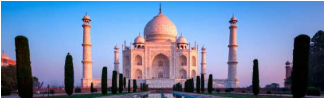
El Taj Mahal

Hasta este momento del relato de la venta de Pastas Gallo no hay nada que objetar, porque la familia fundadora entiende que el proyecto (la Obra ) le sobrepasa porque no dispone de los recursos humanos, financieros o la voluntad de continuar y decide ceder a un tercero la responsabilidad de gestionar la Obra . Lo que supone que el nuevo propietario adquiere el compromiso de gestionar, cuidar, mimar y dotar al proyecto de los recursos e ilusión que la familia fundadora no puede continuar aportando, por capacidad o por voluntad. Nada se le debe objetar a la familia vendedora, porque no está obligada a ello, ni siquiera ante la supuesta motivación caprichosa de haber encontrado un inversor que pague por las acciones un precio extraordinariamente bueno, muy por encima de su valor y del precio de mercado. Incluso hasta el extremo de que las motivaciones de la venta fuese dedicarse a la dolce vita , no debería haber nada que objetar, porque esta es la libertad de mercado.