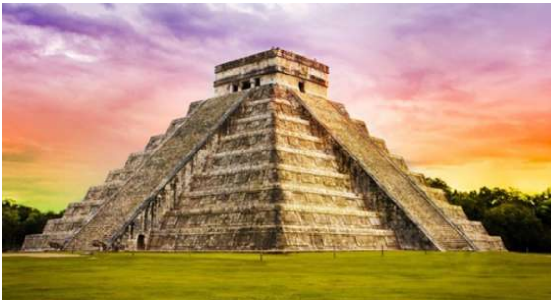
Templo Maya en Chichen Itzá

Lo anterior supone que la Obra no es el resultado del proyecto, sino la presencia de la familia en la empresa , como la garante de la continuidad de una forma de gestionar y de relacionarse con sus empleados. Y desde esta perspectiva, la familia tiene la obligación constitucional de permanecer tutelando la Obra y lo debe hacer más allá de sus capacidades, voluntades y recursos. Y de este modo, se suelen arruinar miles de Obras , que con otra perspectiva y en manos de terceros, podrían continuar en el mercado, aportando bienes, servicios y sobre todo, valor para la economía, para el empleo y para la sociedad en la que operan.