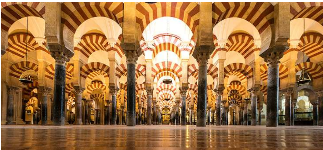
La gran Mezquita de Córdoba

Esta es una de las razones que justifica la excesiva presencia de la familia en todos y cada uno de los actos que se desarrollan en la empresa. En estos escenarios, se actúa como en la nobleza, se adquieren derechos de cuna y lo que es más grave, el apellido per se aporta capacidad para gestionar. ¡Soy un Rodríguez! , ¡Nosotros los Alvarez! . El apellido implica bonanza en la gestión.